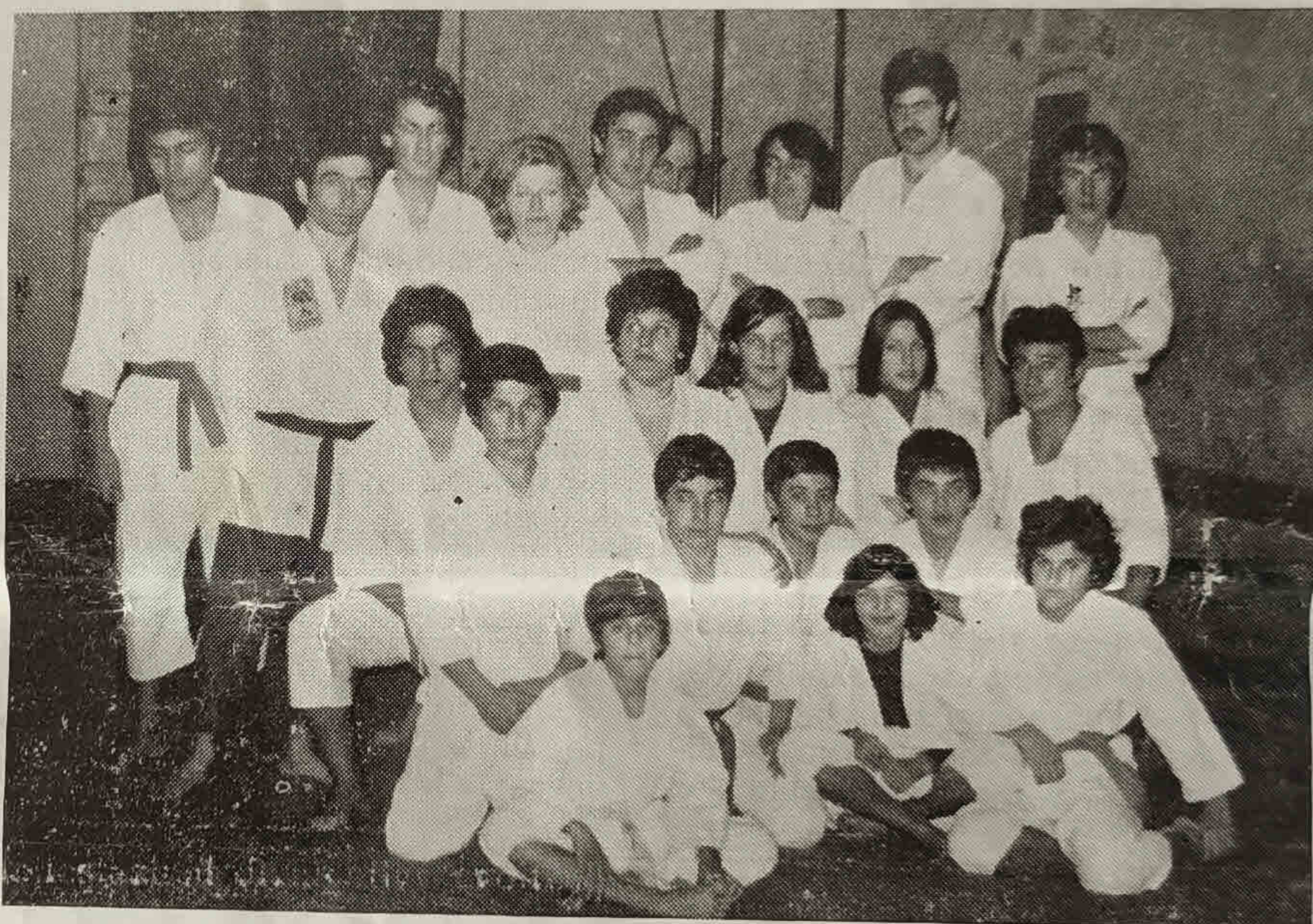
Una formazione del « Gruppo di Finale »