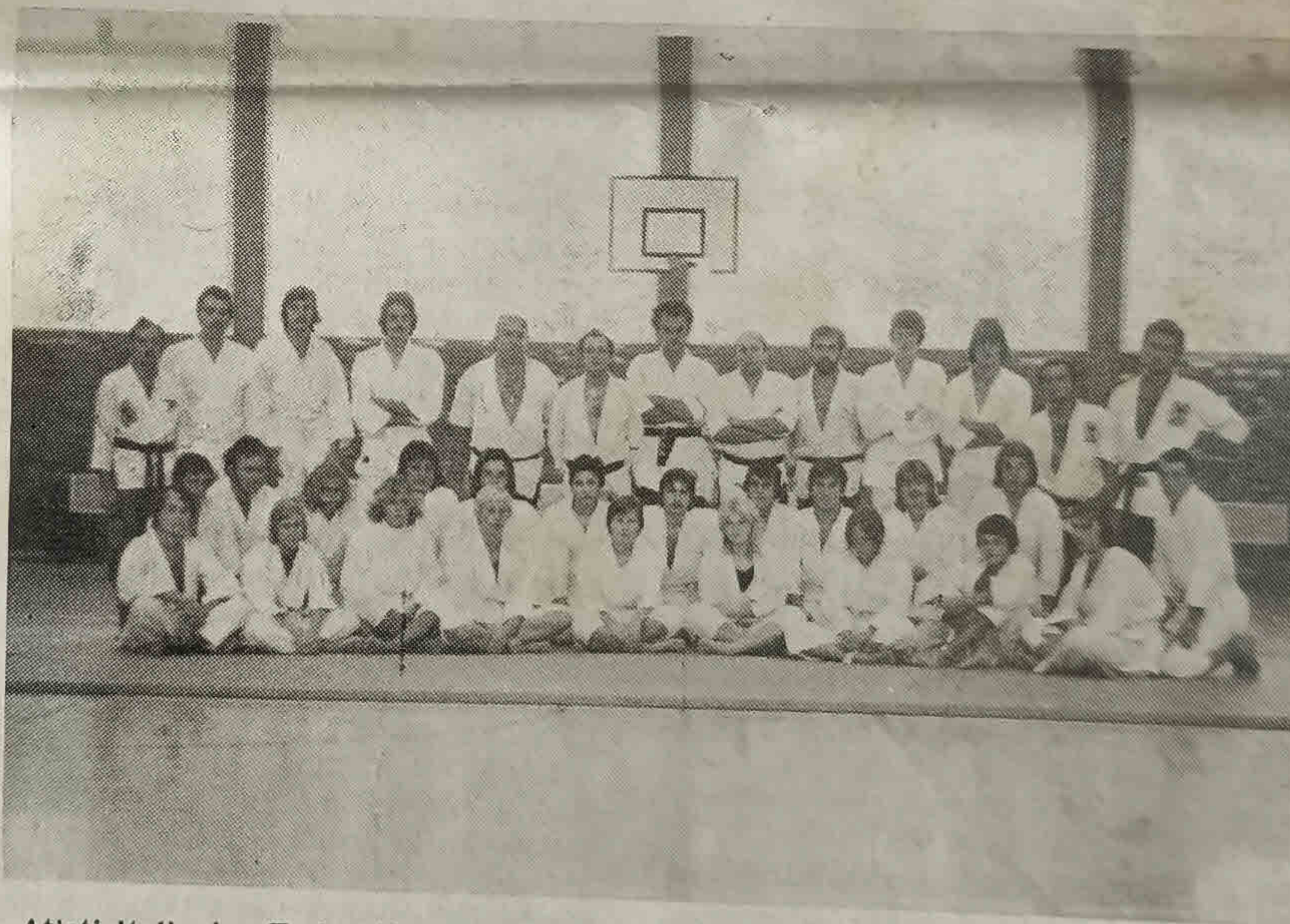
Atleti Italiani e Tedeschi prima della Manifestazione tenutasi a Herzogenaurach

La prima delle tre, ad Arenzano è stata indetta per venire in aiuto al locale gruppo che stava attraversando un periodo un po' difficile per quanto riguardava il numero degli atleti: in seguito la situazione è andata migliorando. La seconda dimostrazione, a Mondovì, è sta-