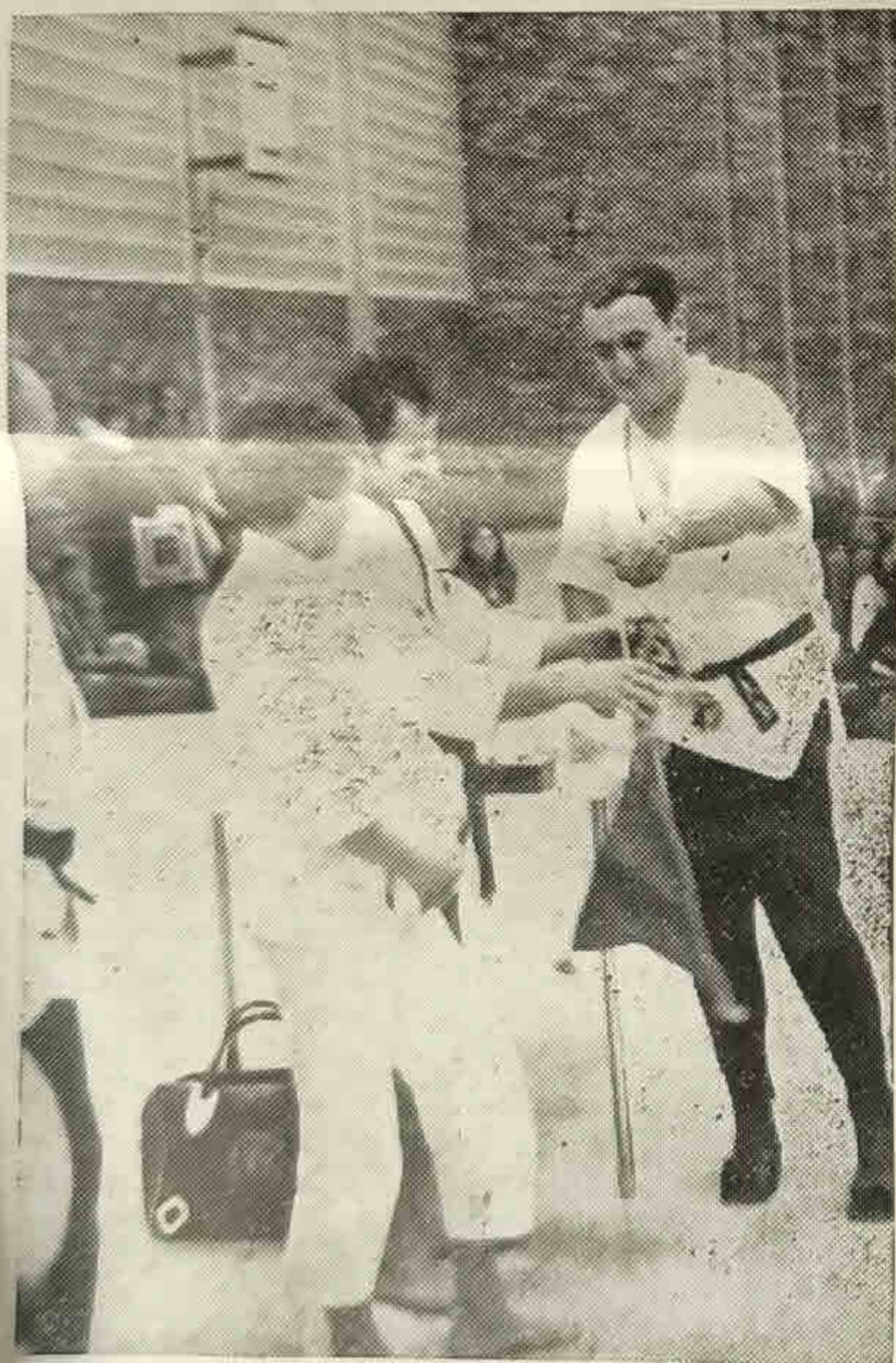
HERZOGENAURACH - Consegna del Gagliardetto alla palestra Tedesca durante la Manifestazione.